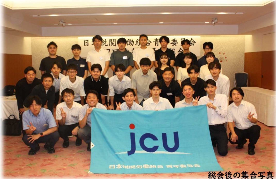
総会後の集合写真