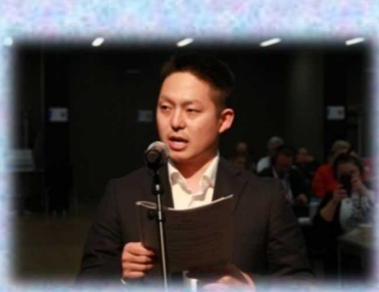
大舞台で発言する筆者

数千人規模の大舞台で発言をするようなことは、今後の人生で二度とないと思います。いい経験になったのは間違いありませんが、何よりも無事に終わって良かったと思っただけで大仕事編でした。