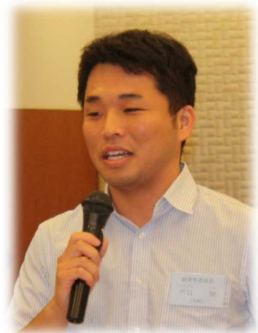
抱負を語る市口委員長 (大阪)